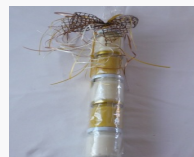
Krenstängla 5 x 50g 4.50EUR